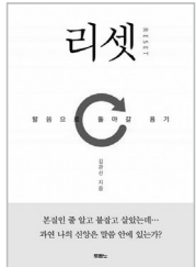
김관선 목사의 저서