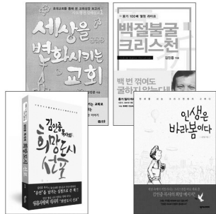
김인중 목사의 저서들

서울대학교 불어교육과 졸업 총신대학원(M.div) 졸업 전) GP선교회 이사장 전) 안산동산고등학교(경기도 자사고) 이사장 전) 사단법인 굿파트너즈 이사장 전) 사회복지법인 동산복지재단 이사장 현) 안산동산교회 원로목사