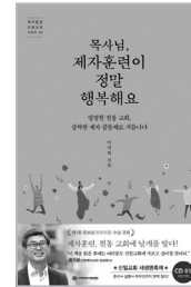
이권희 목사의 저서